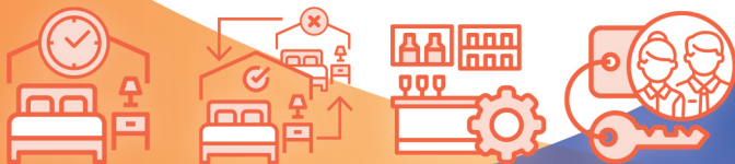
ตัวอย่าง ICON การทำงานในระบบ

ระบบมีฟังก์ชันรองรับกรณีโรงแรมที่พัก มีร้านค้าหรือมินิบาร์ ผู้ใช้งานสามารถทำการออกบิลค่าใช้จ่ายเพิ่มเติม เช่น ค่าขนม เครื่องดื่ม หรือค่าใช้จ่ายอื่น ๆ นอกเหนือจากค่าที่พัก ผ่านโปรแกรมได้โดยทันที